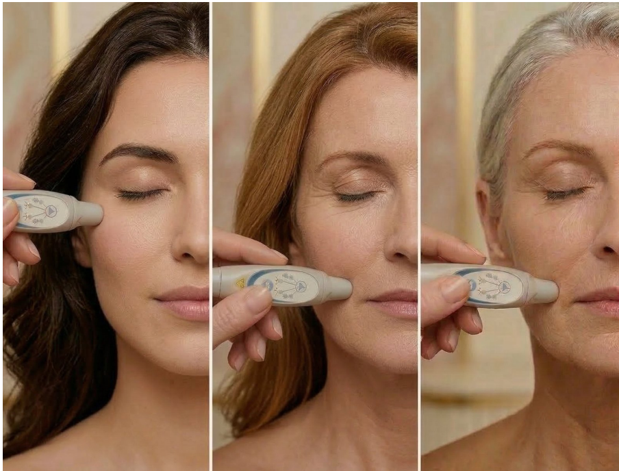
Une prestation adaptée à toutes les clientèles premium

La photobiomodulation esthétique laser répond précisément à cette attente. Elle permet de proposer un soin à forte valeur perçue, confortable, progressif et cohérent avec une esthétique premium. Pour le praticien, c'est un levier concret de différenciation, de fidélisation et de valorisation du panier moyen.