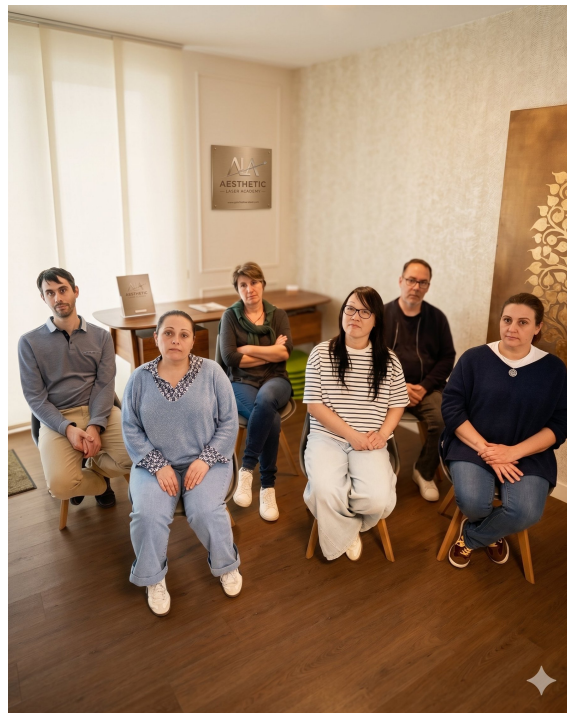
Session de formation en groupe — Mrauk-u

La formation peut être organisée directement dans vos locaux pour :