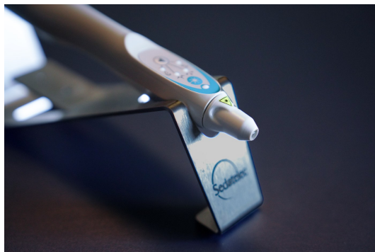
Dispositif Sedatelec Premio · partenaire technologique