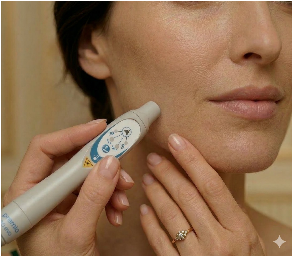
Prise en main du dispositif et maîtrise des gestes