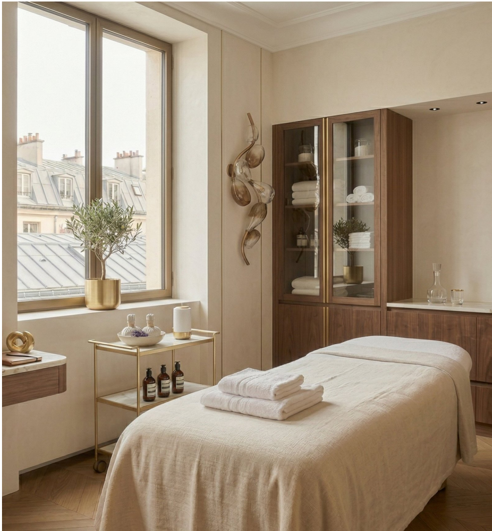
Une méthode premium pour les professionnels exigeants

Cette formation s'adresse aux professionnels qui souhaitent intégrer une méthode crédible, structurée et différenciante dans leur activité :